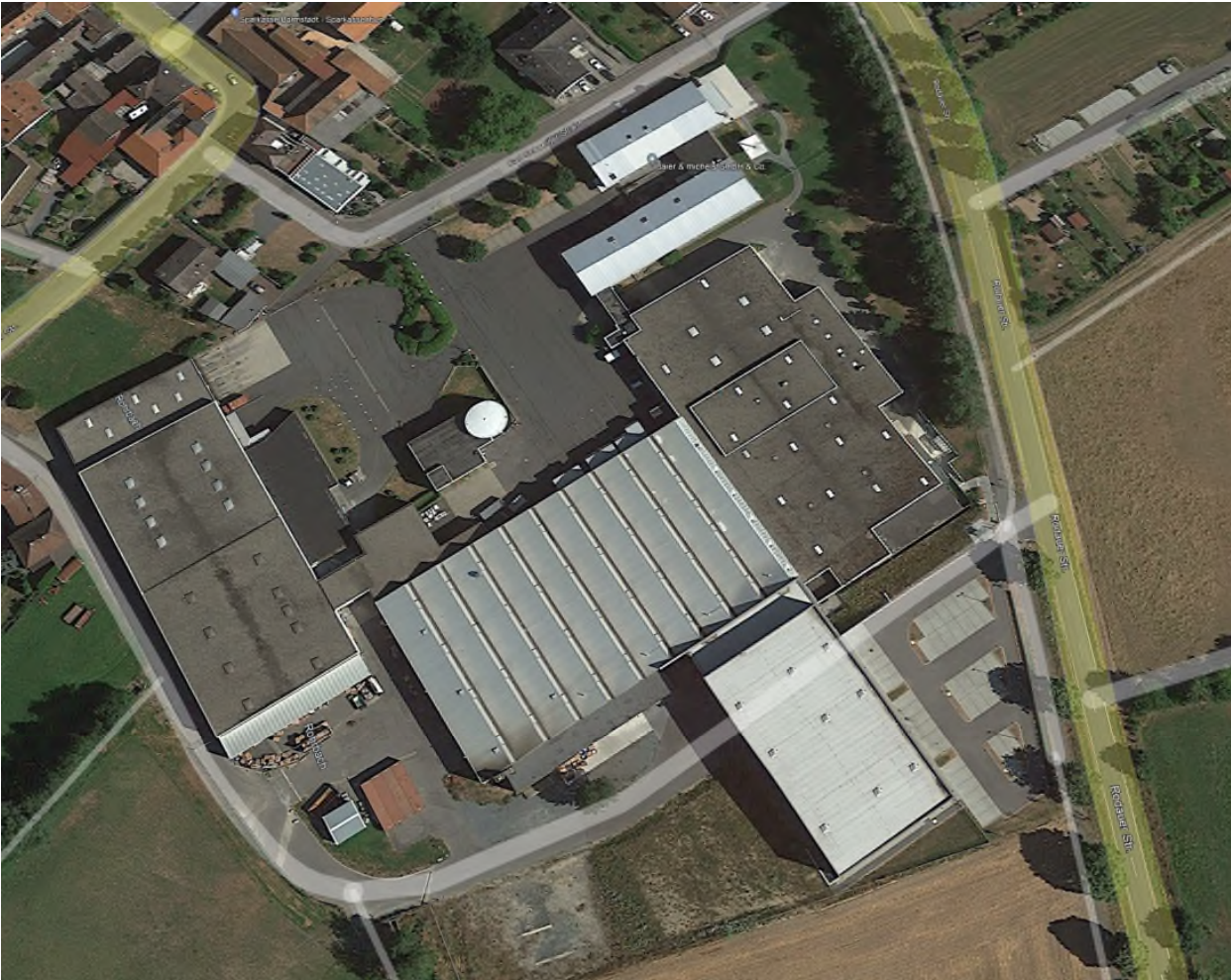
Abbildung 2: Parkfläche südlich der Gewerbeansiedlung, Luftbild 07/2018 (Google Earth)

Die Planungen zur Erweiterung der Betriebsfläche der Fa. Baier und Michels begannen im Jahr 2021, nachdem die südlich und südwestlich an das Betriebsgelände angrenzenden Flurstücke erworben werden konnten. Die ursprüngliche Zufahrtssituation (Zufahrt Parkplatz und Umfahrt von der L3106 aus) soll dabei wiederhergestellt werden.