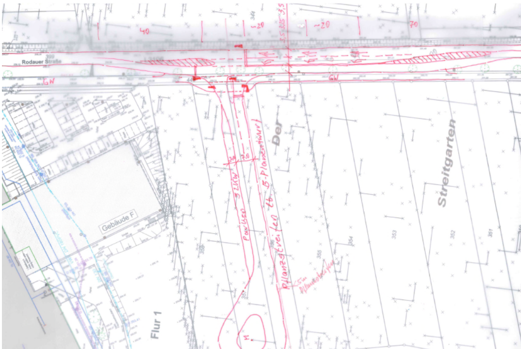
Abbildung 3: Variante LSA-geregelte Einmündung

Das angestrebte Ziel einer geringeren gefahrenen Geschwindigkeit bis zum Ortseingangsbereich wird mit der Lichtsignalanlage und dem zusätzlichen Linksabbiegestreifen nicht erreicht. Die erforderliche Ausbaulänge führt eher dazu, daß die gefahrenen Geschwindigkeiten steigen, da ein sehr großzügiger und breiter Straßenraum entsteht. Dieser Eindruck wird dadurch verstärkt, daß der vorhandene große und alte Baumbestand zwischen der L3106 und dem gemeinsamem Geh- und Radweg / Wirtschaftsweg größtenteils entfällt. Die Variante wurde deshalb nicht weiterverfolgt.